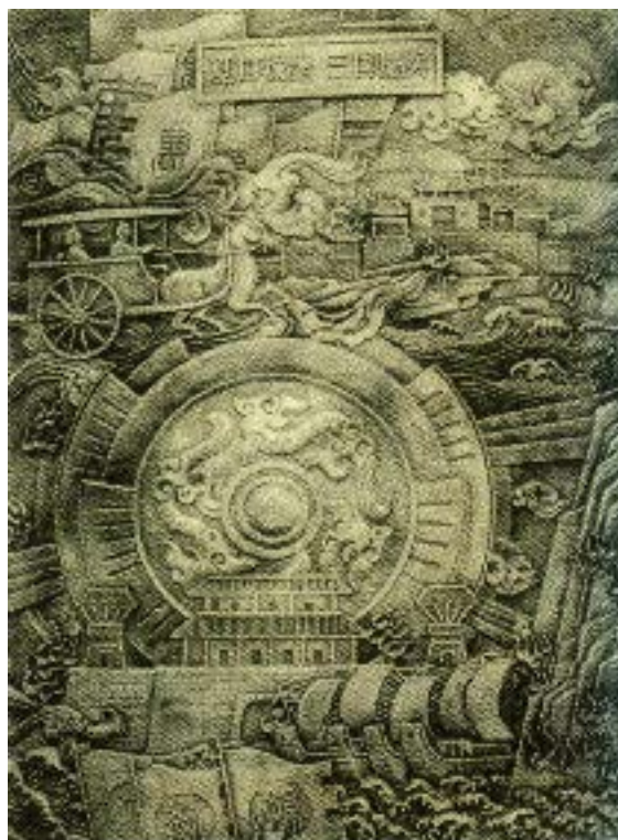
■黄鹤楼千禧钟上的《三国鏖兵图》

如雷鸣，小城地势极为险要。孙权把长江对岸的“夏口”之名，移作这个小土城的名字，并派部将黄盖在沿江一带训练水军，以抗曹、刘。这个小城便是最早的武昌城。就在夏口城诞生的同时，城西南隅蛇山伸入长江的矶头上，一座用于观察、指挥的戍楼突兀而起。这座小楼历经烽火，数百年默默无闻，直到晋唐，战事平息，它逐渐演变成人们游赏用的楼阁，这才有了一个优雅的名字：“黄鹤楼”。