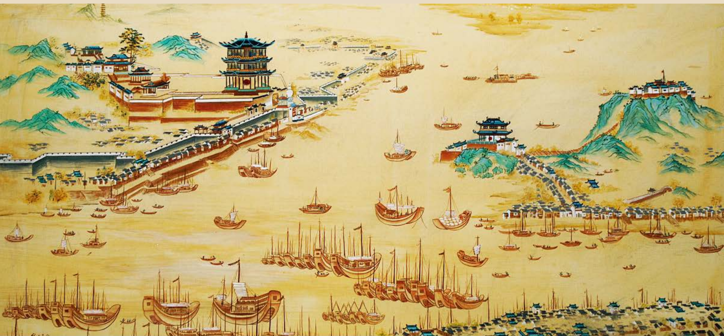
■古武汉三镇鸟瞰图