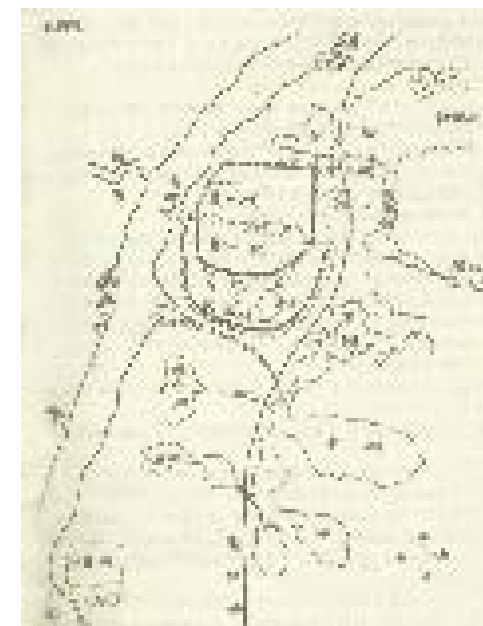
■夏口城演变图。三国吴黄武二年（223）筑夏口城，南北朝宋孝建元年（454）改建为郢州城，隋开皇九年（589）改郢州为鄂州城，元大德五年（1301）改鄂州为武昌城。从此，今日武汉市的江南部分正式有了“武昌”这个地名。

如雷鸣，小城地势极为险要。孙权把长江对岸的“夏口”之名，移作这个小土城的名字，并派部将黄盖在沿江一带训练水军，以抗曹、刘。这个小城便是最早的武昌城。就在夏口城诞生的同时，城西南隅蛇山伸入长江的矶头上，一座用于观察、指挥的戍楼突兀而起。这座小楼历经烽火，数百年默默无闻，直到晋唐，战事平息，它逐渐演变成人们游赏用的楼阁，这才有了一个优雅的名字：“黄鹤楼”。