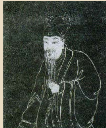
■陆游（1125—1210） 南宋孝宗时赐进士出身，官至宝章阁待制。中国诗史上最多产的诗人，现存诗9000余首。

历史上的黄鹤楼屡建屡毁，又屡毁屡建。晋楼古拙朴实，唐楼巍峨舒展，宋楼危檐高槛，元楼渺若仙宫，明楼雍容华贵，清楼宏伟严谨。历代的能工巧匠用心血