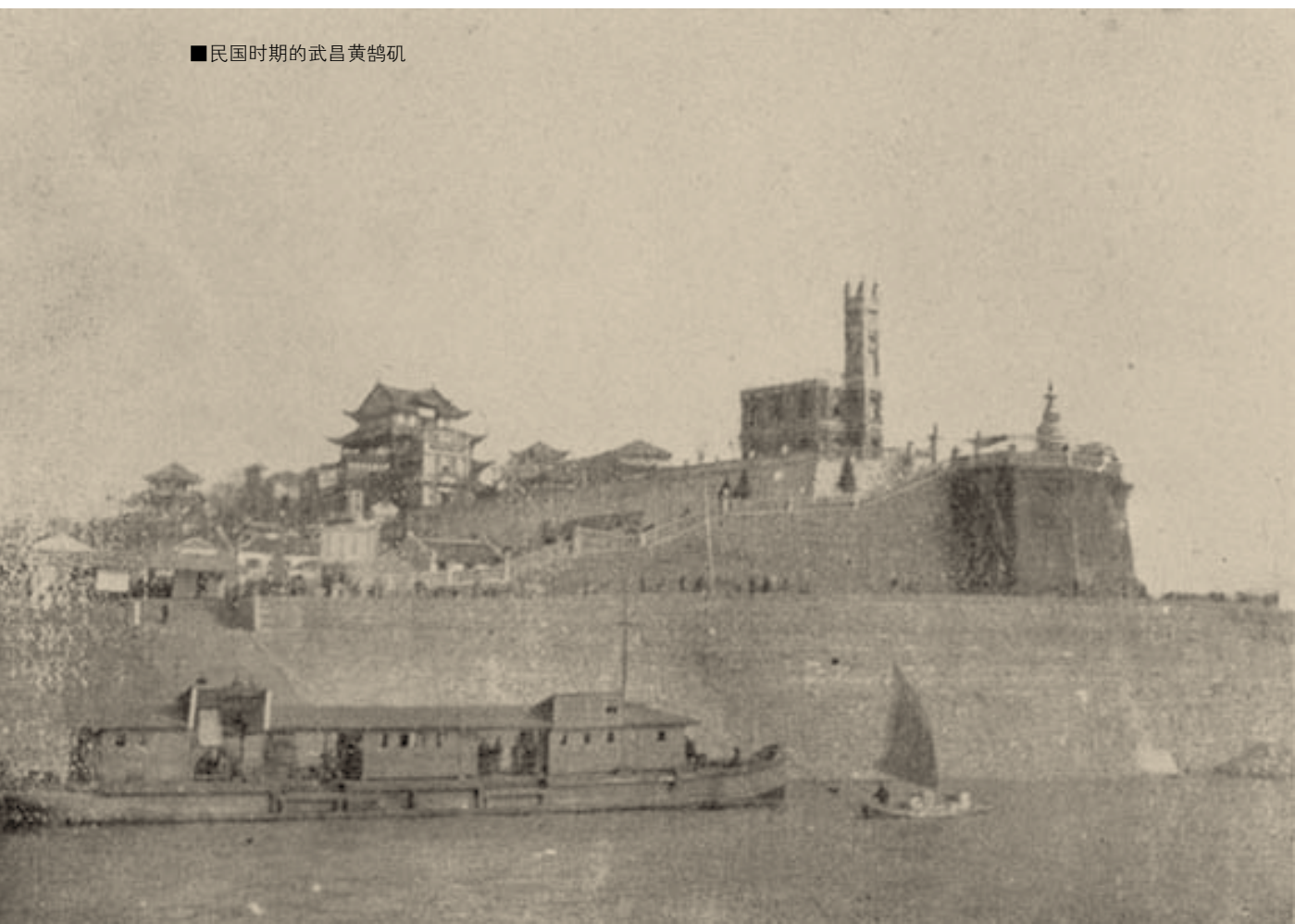
■民国时期的武昌黄鹤楼

其实，陆游此行黄鹤楼实体已不存在。但自陆游此行上溯500多年前起，历代文人墨客、王侯将相、英雄豪杰、庶民百姓，莫不争相登临黄鹤楼，留下了数不尽的传说、诗文、楹联、绘画等，使黄鹤楼积淀了丰厚的文化内涵。具有1700多年历史的黄鹤楼经历和见证了中国历史上的一系列重大事件：三国鏖兵、岳飞抗金、天王